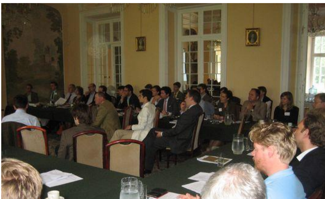
Bild tagen från The Vanenburg Meeting i Warszawa

En delegation bestående av medlemmar ur förbundet deltog även som representanter vid The Vanenburg Meeting i Warszawa, Polen. Vanenburg-mötet är en årlig konferens där intellektuella konservativa från över 25 länder på alla kontinenter träffas. Konservativa Förbundet presenterade sig för övriga deltagare, och höll en "country report" om det rådande tillståndet för konservatismen i Sverige.