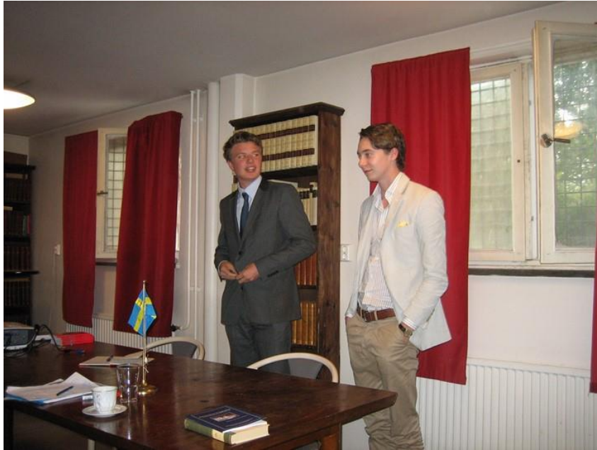
Två av KF:s grundare presenterar förbundet på Konservativt Forums 10-årsjubileum i Uppsala 2012

Så småningom beslutade sig ett flertal aktiva inom Konservativt Forum för att starta Tradition & Fason, en konservativ nättidskrift som under tre års tid publicerade tusentals artiklar inom allehanda konservativa ämnen. Det var också medlemmar från Konservativt Forum som bildade Förenade Monarkister, avsedd som ett försök att ge unga konservativa den plattform i media som de annars förnekades.